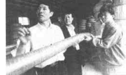
该镇“东营市海虹橡塑有限公司”与法国来利格公司合资生产的“PE夹铝增强复合管”，填补了国内空白，已被列入省星火项目。