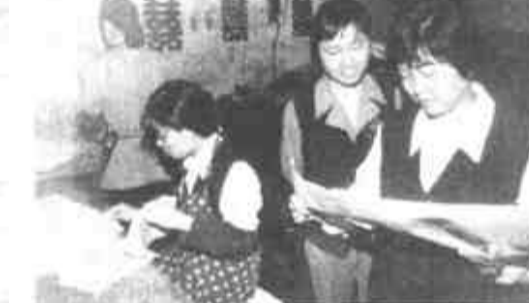
刁炉村的印刷生产正朝着专业性集团方向发展。