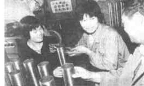
许多来自县城的失业、下岗人员慕名来该镇个体私营企业打工。