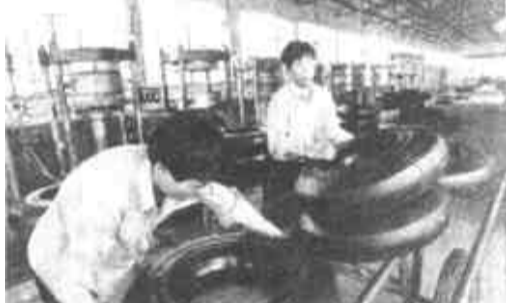
橡胶生产在该镇已形成龙头，产品畅销全国各地。

广饶县稻庄镇认真贯彻落实党的十五大精神，放手发展个体私营经济，初步形成了以橡胶、塑料、五金、铸造、建材、印刷、化工等行业为主体的系列化、多品种的生产格局。截至5月底，该镇个体私营企业已达684家，产值6亿余元，利税2645万元，成为全镇经济建设的一支生力军。